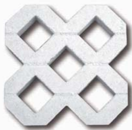
CELOSIA DE JARDIN 50x50x8 26 Kg - 44 uds/palet