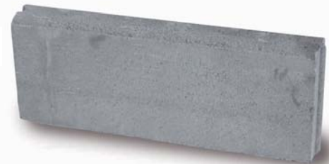
BORDILLO JARDÍN 50, 20, 6 - 15 Kg - 130 Uds/Palet