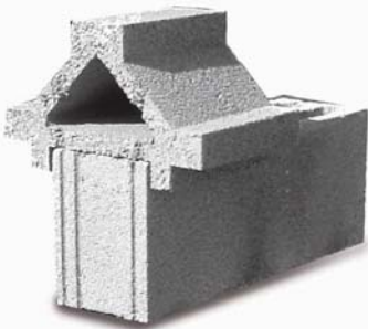
CUBREMUIROS PIRÁMIDE 20x18x30 - 8,3 Kg